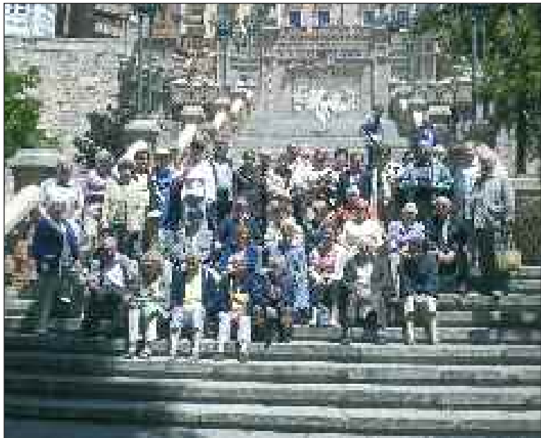
Le groupe réuni devant la cathédrale de Teruel

Du 14 au 18 juin, une quarantaine d'Aînés se sont rendus au cœur de l'Espagne.