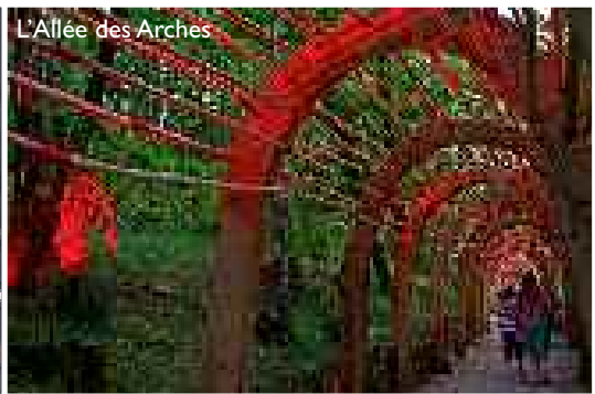
L'Allée des Arches