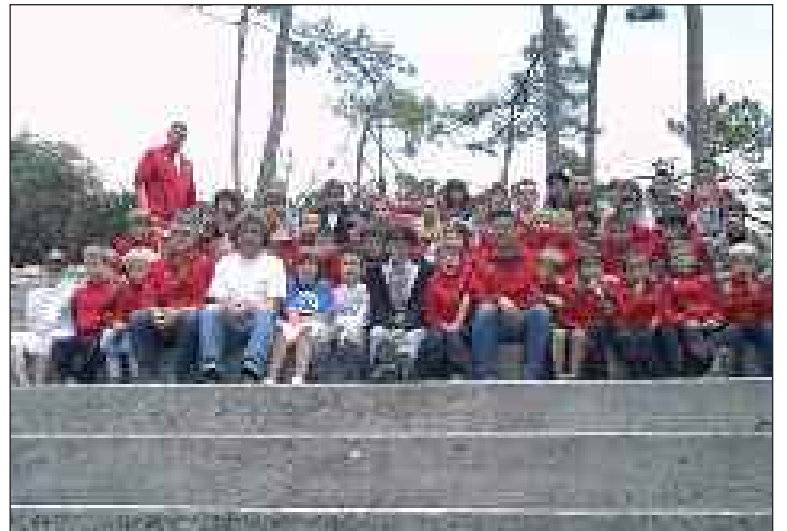
Que de souvenirs !

Dimanche soir, à la descente du car, tous semblaient heureux d'avoir partagé ces moments qui restent inoubliables, la baignade dans l'Océan, la bataille de polochons..., et qui participent à entretenir l'esprit d'équipe.