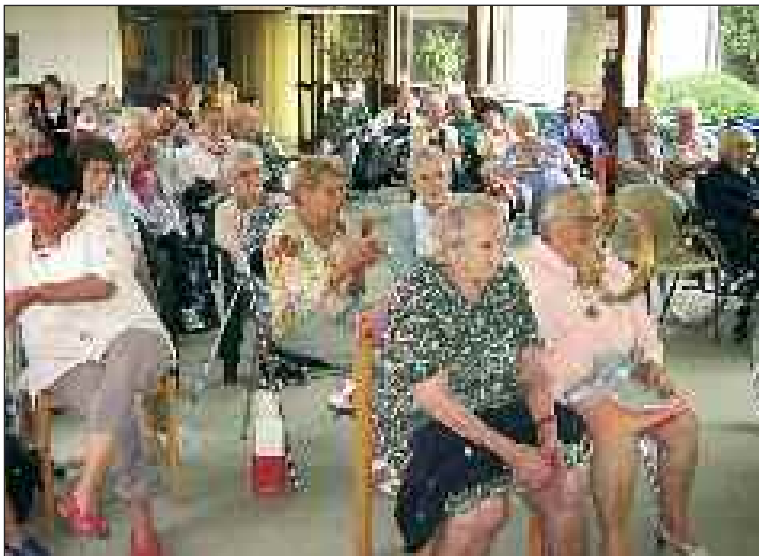
Une fête de famille très chaleureuse