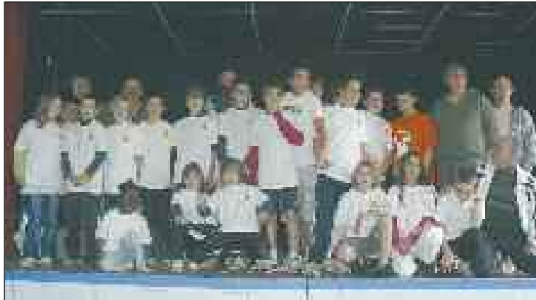
Tous réunis après une très belle année sportive