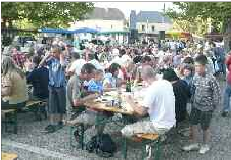
Avec l'été, c'est le retour des dégustades