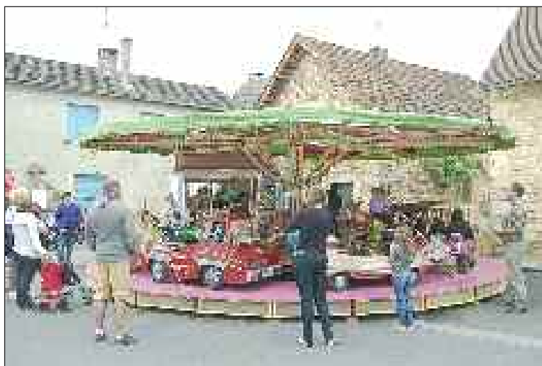
"Roulez petits bolides"