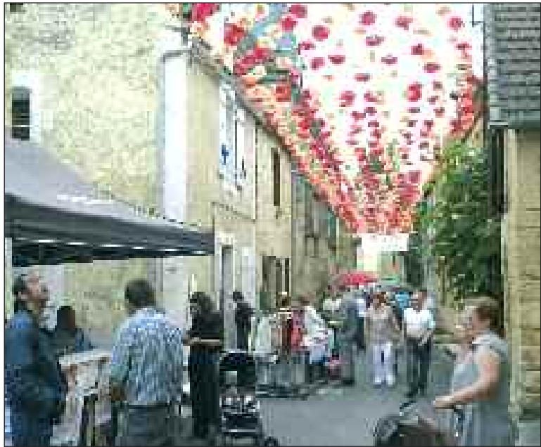
La rue déjà décorée pour la Félibrée