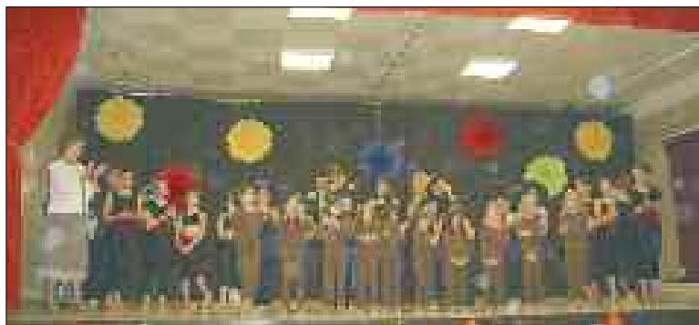
Les jeunes danseurs sur scène après leurs prestations