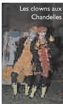
Les clowns aux Chandelles

DÉCOUVREZ LA VALLÉE DE LA DORDOGNE AUTREMENT !