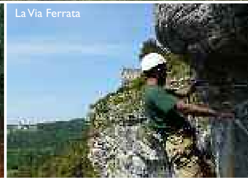
La Via Ferrata