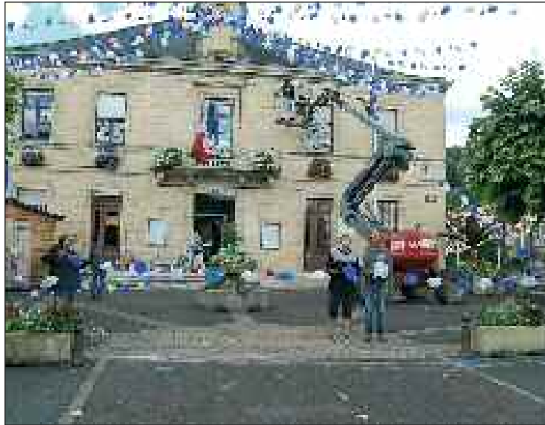
On habille la mairie