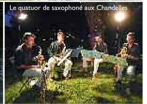
Le quatuor de saxophoné aux Chandelles