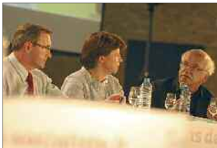
Germinal Peiro, Martine Aubry et Erik Orsenna